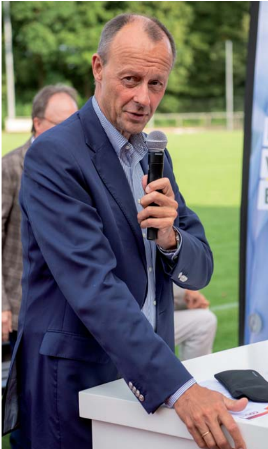
Friedrich Merz beim Stadionggespräch in Hennef

Corona hat auch unsere praktische Arbeit vor Ort verändert. Das traditionelle Hennefer Fabrikgespräch kann seit Beginn der Corona-Pandemie in bekannter Weise nicht mehr stattfinden. So haben wir kurzerhand aus dem Fabrikgespräch ein Stadionggespräch gemacht und konnten mit Friedrich Merz einen herausragenden Vertreter der CDU Deutschland für eine interessante Podiumsdiskussion in Hennef gewinnen.